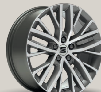
PERFORMANCE I 18" XC