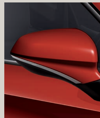
PURE ČERVENÁ R St XC FR