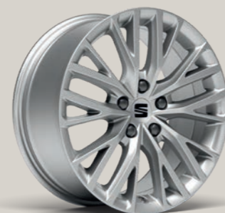
DYNAMIC I 17" XC