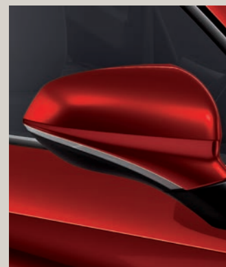
DESIRE ČERVENÁ XC FR