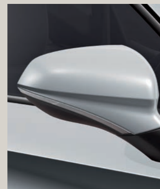
NEVADA BÍLÁ XC FR