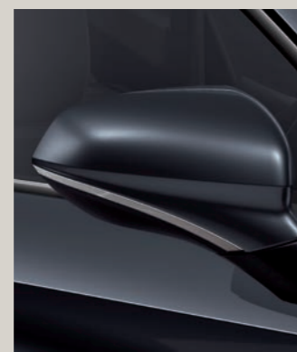
MAGNETIC ŠEDÁ R St XC FR