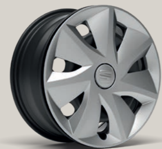
URBAN 16" R