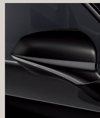
MIDNIGHT ČERNÁ R St XC FR

Reference R Style St Xcellence XC FR FR Standardní výbava ■ Výbava na přání ■