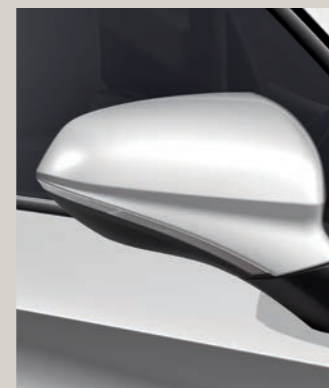
CANDY BÍLÁ R St XC FR