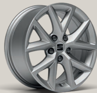
URBAN 16" R St