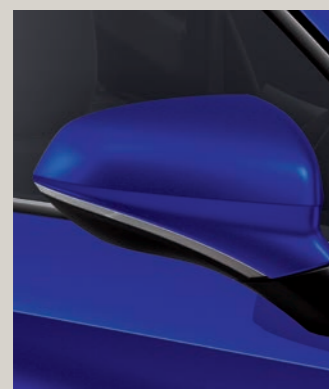
MYSTERY MODRÁ R St XC FR