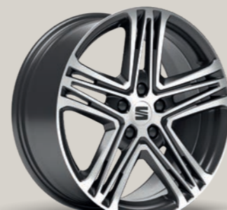
SPORT I 18" XC