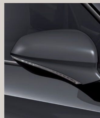
GRAPHENE ŠEDÁ FR