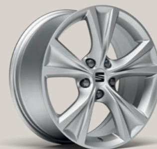
DYNAMIC II 17" FR