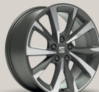
PERFORMANCE II 18" FR