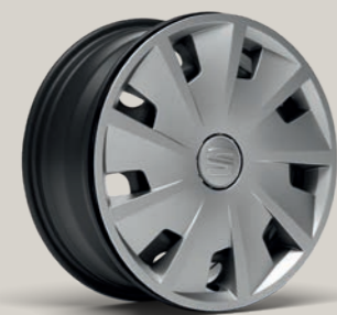
URBAN 15" R