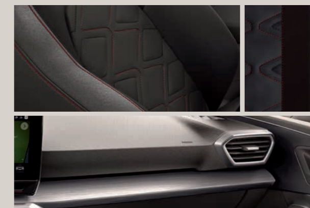
KŮŽE NAPPA FR