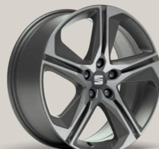
SPORT II 18" 2 FR