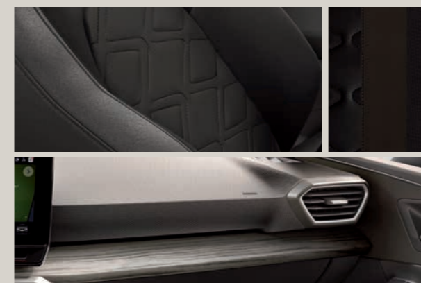
KŮŽE NAPPA XCELLENCE